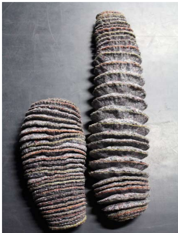
Myriam Colin, Habitats 2 , 2012, Volumes en feutre