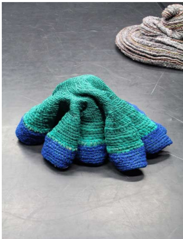
Myriam Colin, Objet évolutif , 2017/18 Volume en filets

TOUCHE est soutenu par Le Tigre, réseau Jeune Public Grand Est (Lauréat de l'appel à projet Les griffes du Tigre ) Il a également bénéficié de l'aide de l'Agence culturelle Grand Est au titre du dispositif « Tournée de coopération ».