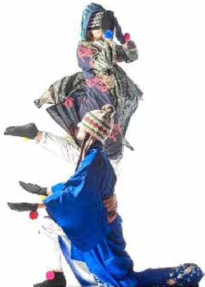
Les petites formes des voyages seront interprétées en duo. La plus grande version sera dansée par quatre interprètes.